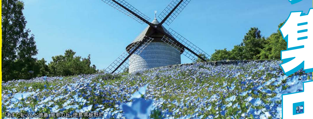
「あすむらんど徳島 風車の丘」徳島県板野町