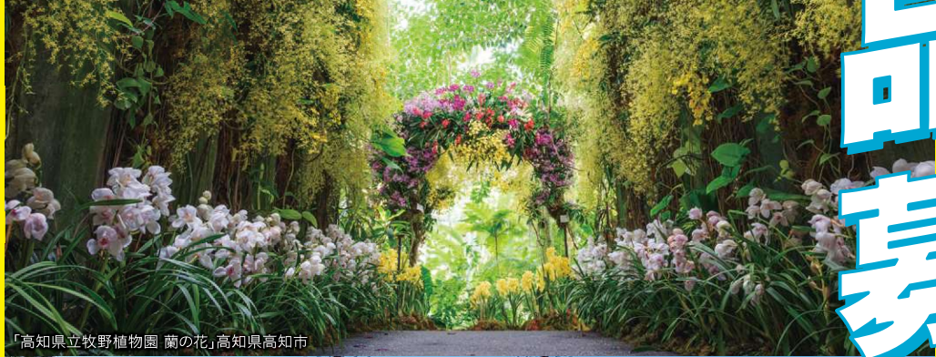
「高知県立牧野植物園 蘭の花」高知県高知市