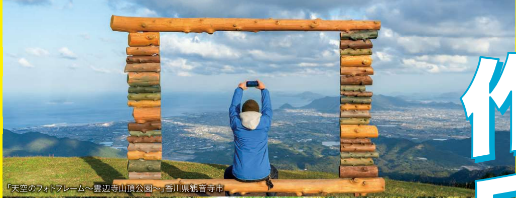
「天空のフォトフレーム～雲辺寺山頂公園～」香川県観音寺市