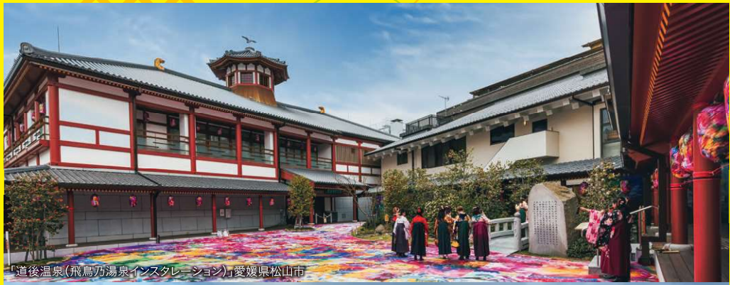
「道後温泉(飛鳥乃湯泉インスタレーション)」愛媛県松山市